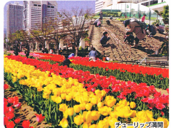
チューリップ満開