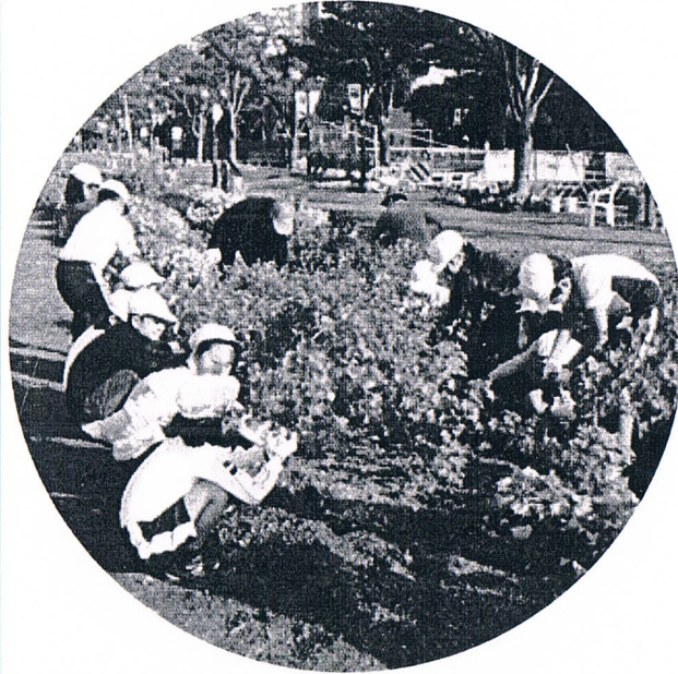
六甲アイランド小3年生 赤花ソバ抜き

わたしは、そばぬき体けんを、たくさんのそばをぬきました。そばをぬくのほ、思っていたほど、むずかしくありませんでした。わたしは、そばを、10本から、30本ぐらい、ぬきました。ぬいていると、「んきか」エド」かけになりました。 そばの花は、ピンクと赤をまぜたような色でした。くまや葉は緑色でした。みんながぬいていると、あ、という間に終わりました。そばをぬき終わった時は、とてもすき、きりして、気持ちがよかったです。またぬきたいと思いました。