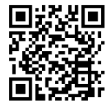
サツマイモを育てる会メール

六甲アイランドを美しい街にする会 サツマイモを育てる会 HP : https://ricpotato2.jimdo.com/