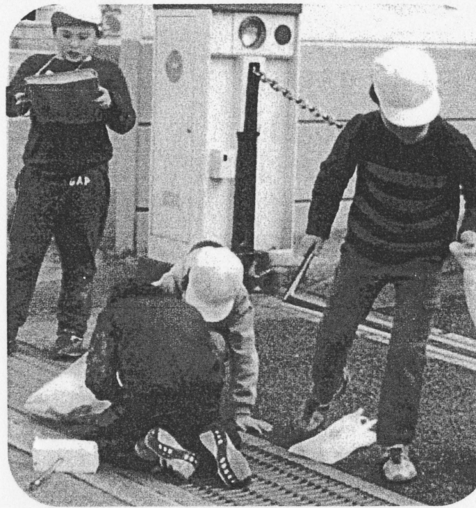
六甲アイランド小4年生 クリーン活動

1月のクリーン作戦をやりました。今回は、たはこが思ったよりも少なかったもので、びっくりしました。今回一番多かったのは、紙くず、30こです。わたしは、予想もしていなかったもので、びっくりしました。次は3月に3年生といっしょにやるのでがんばりたいと思っています。