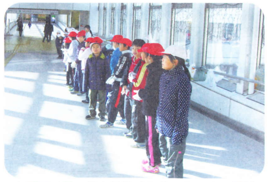
六甲アイランド小学校4年生のあいさつ運動

大阪から六甲アイランドに越してきてまもなく11年になります。住まいは今までよりもかなり狭くなりましたが、美しい環境が魅力でした。この環境を保つために努力しているグループがあることを知り、参加することにしました。「六甲アイランドを美しい街にする会」です。月2回のクリーン活動、いわゆるゴミ拾いが私の主な仕事です。一見きれいに見える道路でも、目を光らせると、タバコの吸殻、コンビニの袋、空き缶、ペットボトル等々が捨てられているのに驚きました。とくにタバコの吸殻の多さは想像以上でした。これは島の住民ではなく、外来者の仕事と信じています。この島では朝夕に犬の散歩をよくみかけます。糞は自宅に持ち帰って処理するのが常識です。ところが、ときどきビニール袋に入れた糞が道路の生垣の中に捨てられているのです。これはおそらく島の人でしょう。残念なことです。