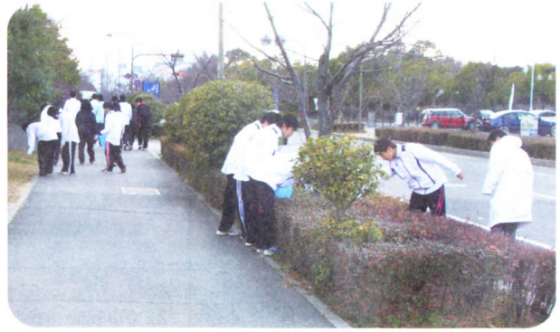
六甲アイランド高校の島内クリーン作戦

一月十七日に島内クリーン作戦をしました。部活動の有志と美化保健委員、風紀委員、生徒会、あわせて六百人以上の人が参加してくれました。南側の海岸から、アイランド北口の手前まで清掃しましたが、たくさんゴミが出ました。特に多かったのが、タバコの吸殻です。班ごとに清掃場所が分かれていたのですが、タバコの吸殻は、どの清掃場所からも出ました。マリンパーク駅の周辺では、風紀委員の人がガム取りをしてくれました。人数や時間の都合で、マリンパーク駅の周辺しかできませんでしたが、地面にくっついたガムを取るのには、とても大変でした。他にもビニール袋や飲みかけの缶やペットボトル、壊れた傘などがありました。清掃している時に地域の方から「ありがとう」と言われた人もいます。とても心が温ま